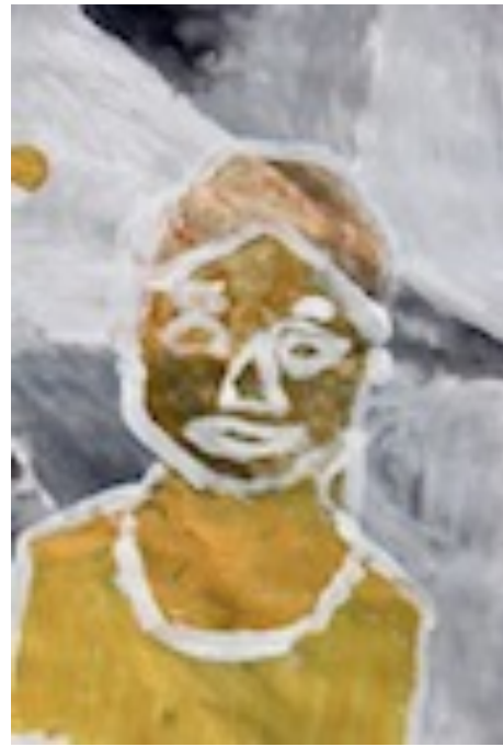
Quelques résultats des séances 3 et 4 :