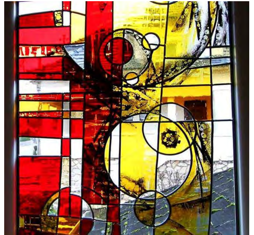
Vu de l'intérieur (dedans)