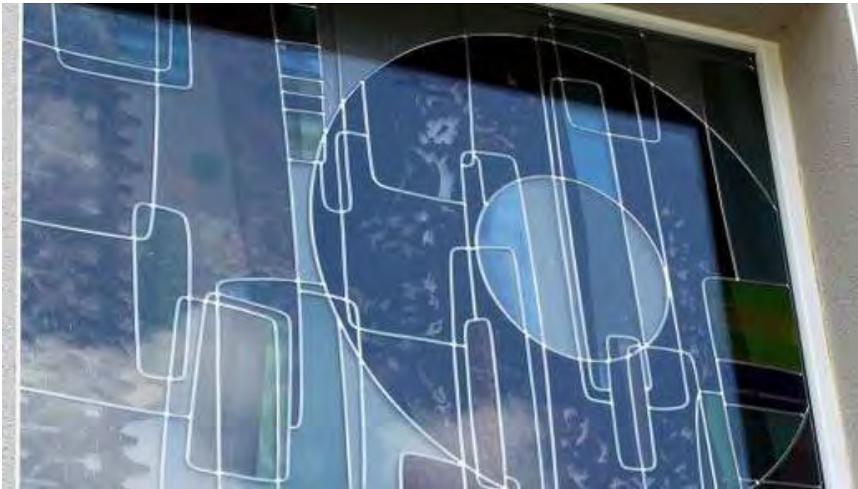
Vu de l'extérieur (dehors)