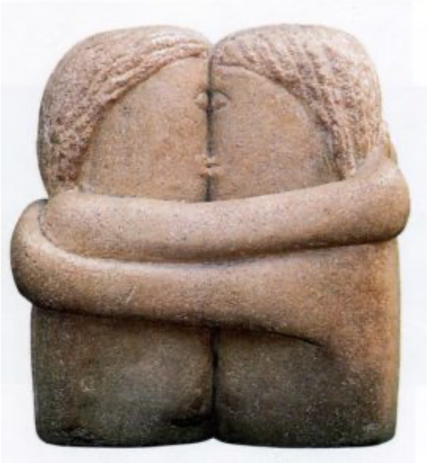
Centre G. Pompidou Constantin Brancusi (1876 – 1957) Le Baiser