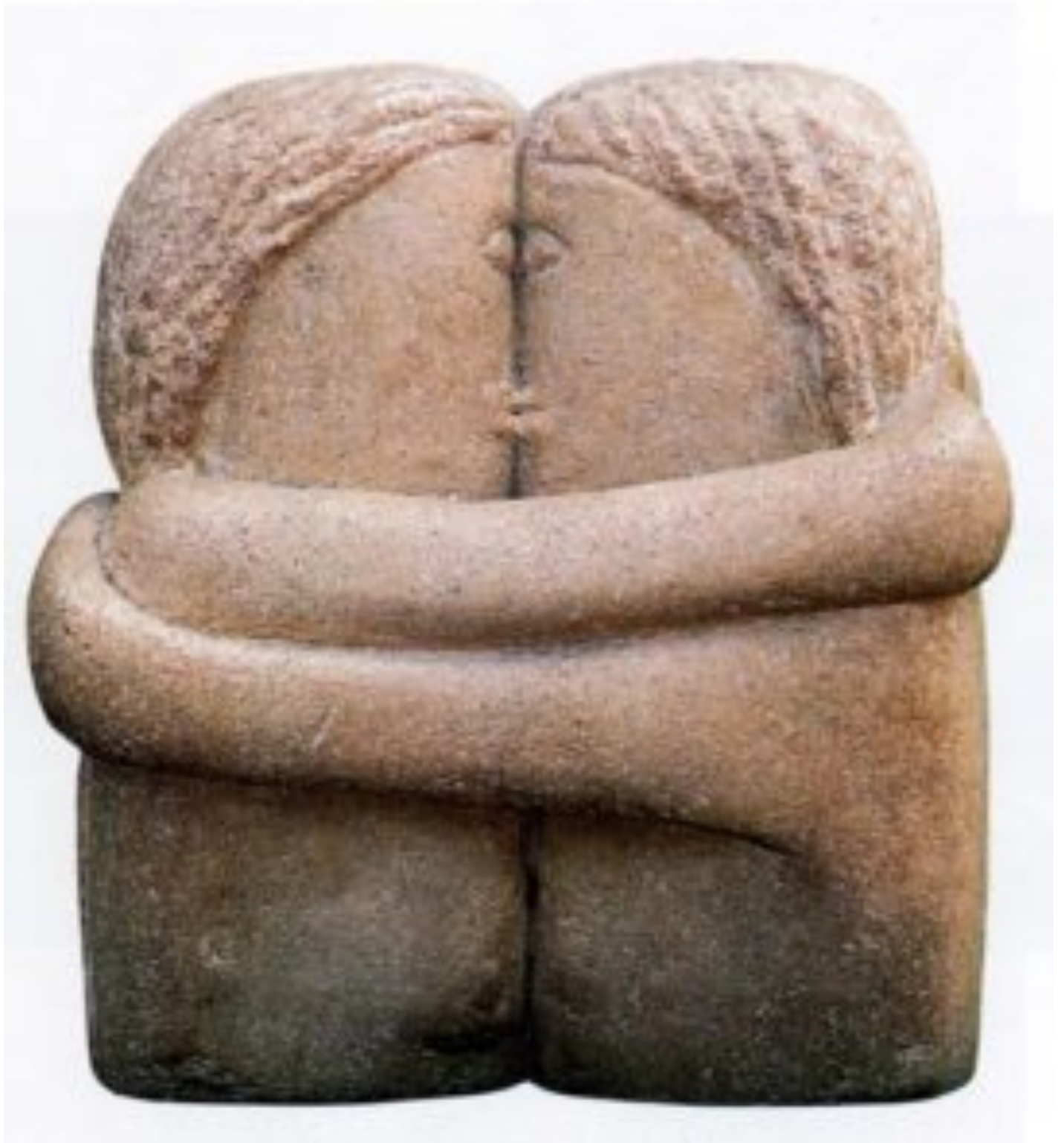
Centre G. Pompidou Constantin Brancusi (1876 – 1957) Le Baiser