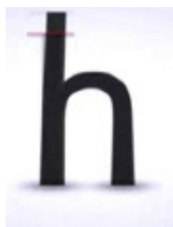
Allongement de la barre ascendante ou descendante