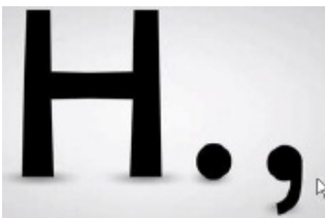
Majuscules et ponctuation en gras

Ces macros ont le mérite d'exister, mais idéalement il conviendrait de les adapter aux besoins spécifiques de l'élève dyslexique ou dyspraxique et de les modifier quand il progresse.