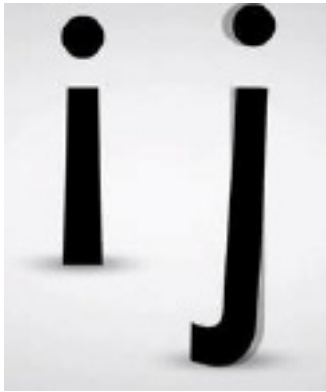
Inclinaison des caractères qui se ressemblent