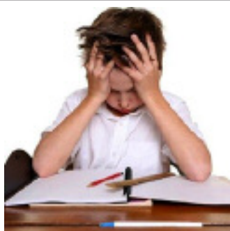
En France, 6 à 8 % des élèves d'une classe d'âge seraient dyslexiques