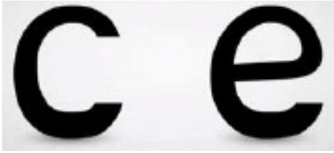
Augmenter l'ouverture des caractères