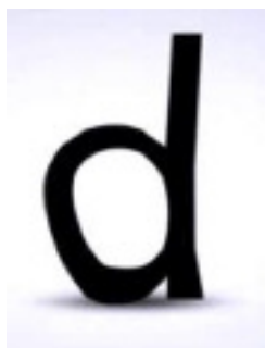
Epaississement des caractères sur leur ligne de base