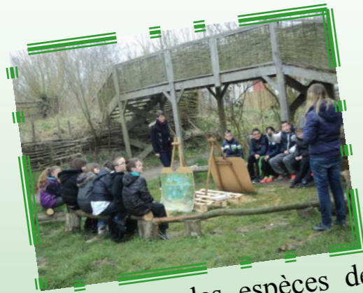
Découverte des espèces de la mare au Centre d'Etude de la Nature du Houtland (CENH)