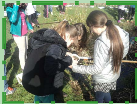
Notre mare à l'école : pêche et mesure de la profondeur