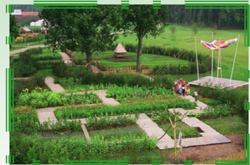
Le parc Mosaïc