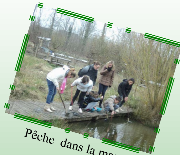
Pêche dans la mare