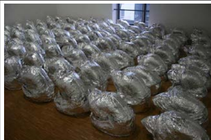
Ghost , 2007, Installation de 102 pièces, Feuilles d'aluminium compressées