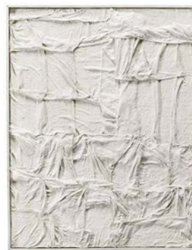
Achrome vers 1959 Kaolin on pleated canvas 25 x 35 cm.