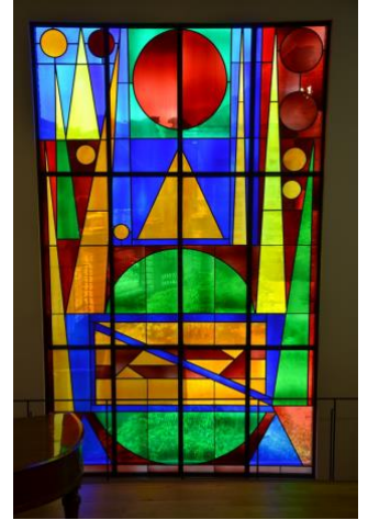
Auguste HERBIN , Joie , 1957, vitrail