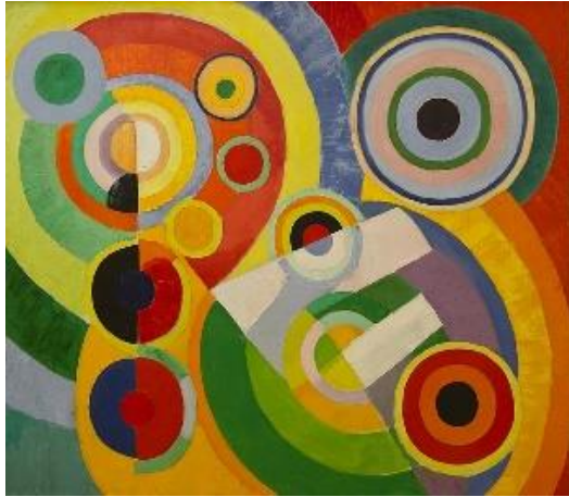
Robert DELAUNAY , Rythme, Joie de vivre , 1930, huile sur toile

Des œuvres d'artistes soulevant les notions abordées seront projetées aux élèves afin qu'ils puissent établir un parallèle avec leur production.