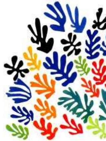
Henri Matisse , céramique Source d'inspiration aux Editions Sarrasin (1977)