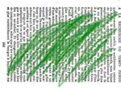
Il souffle d'un coté