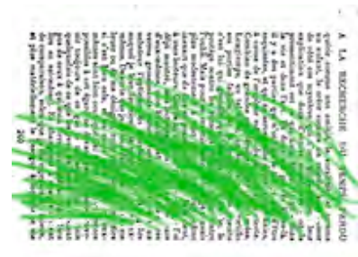
Il souffle de l'autre coté