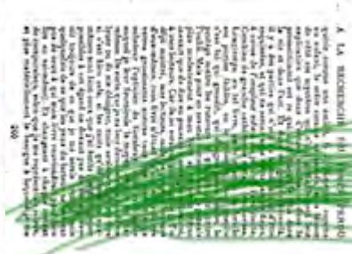
Plus fort !