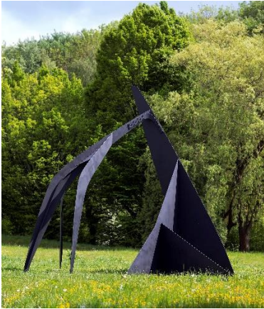
Calder, Guillotine pour huit , 1963 LAM Lille,

Certains artistes ont fait comme toi, des sculptures avec des surfaces et des plans imbriqués, Calder par exemple aimait beaucoup jouer sur l'équilibre et le déséquilibre. Il a créé des sculptures appelées des stables par opposition à ses mobiles qui étaient des sculptures mouvantes. Voici un lien pour prendre des informations sur l'artiste : https://fr.wikipedia.org/wiki/Alexander_Calder Regarde cette œuvre, ne te fait-elle pas penser à ta propre création ? Peut-être as-tu déjà vu cette sculpture de Calder à l'entrée du parc du musée du LAM ?