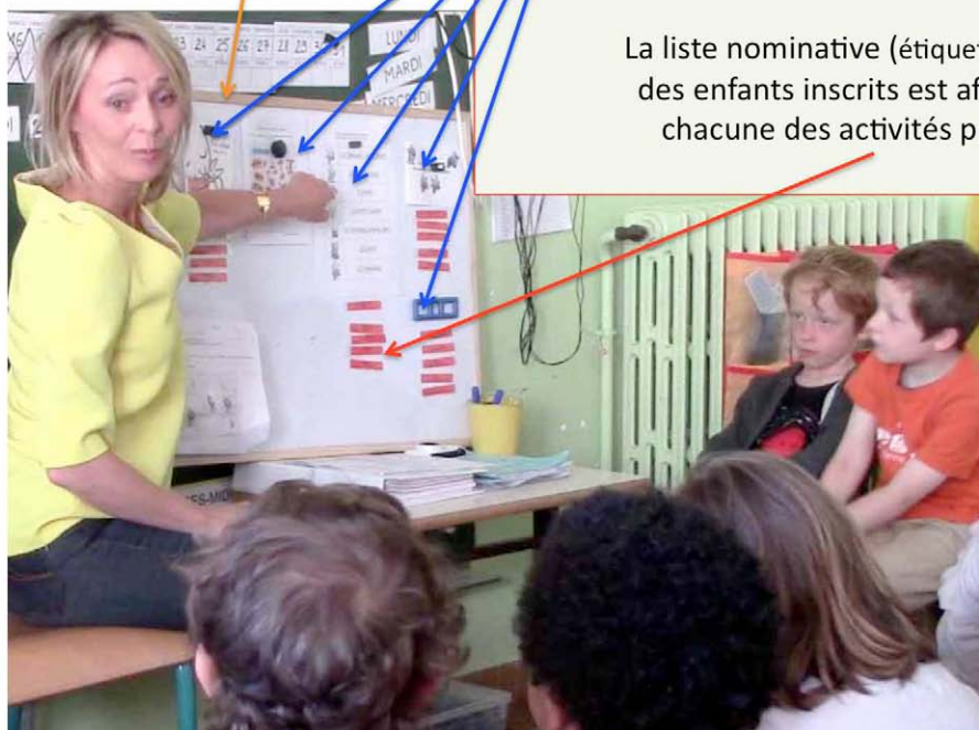
Classe de MS/GS

La liste nominative (étiquettes prénoms) des enfants inscrits est affichée sous chacune des activités proposées.