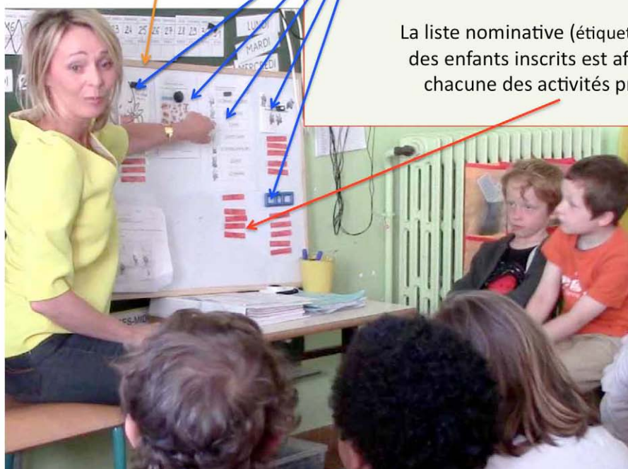
Classe de MS/GS

La liste nominative (étiquettes prénoms) des enfants inscrits est affichée sous chacune des activités proposées.