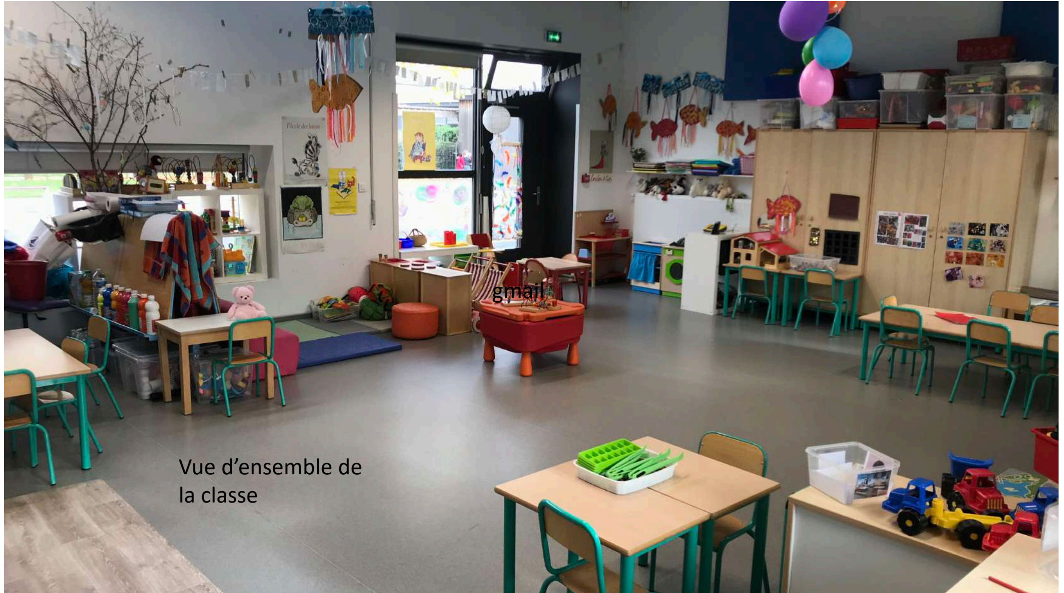
Vue d'ensemble de la classe