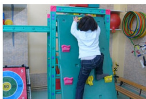
Agir, s'exprimer, comprendre à travers l'activité physique