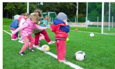
Les activités physiques