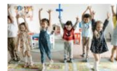
Connaître et respecter le développement et les besoins de l'enfant