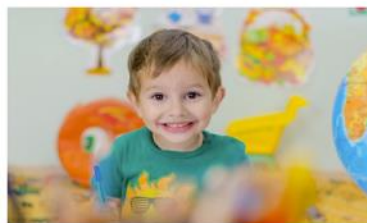
Explorer le monde