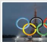
Semaine des langues