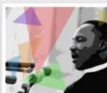
Martin Luther K Day