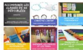
Accompagner les classes de GS dédoublées