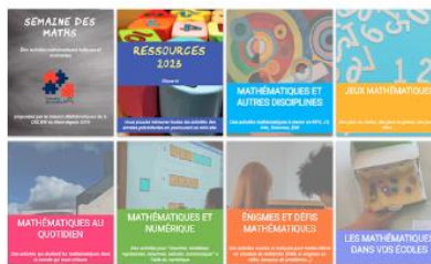
Semaine des mathématiques