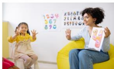
Les premiers outils mathématiques