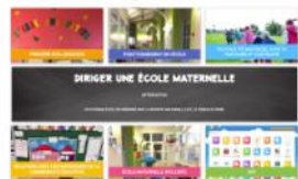
Diriger une école maternelle