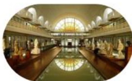
Histoire des arts