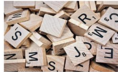
Entrée dans l'écrit C1-C2