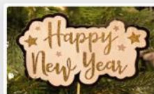
New year resolutions