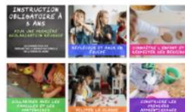
Instruction obligatoire à 3 ans