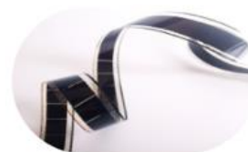
École et cinéma