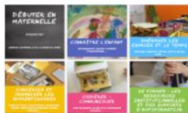
Débuter en maternelle

Répertoire de toutes les ressources proposées par la mission Maternelle de la DSDEN du Nord