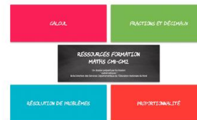
Ressources pour la formation CM1-CM2