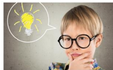
Résolution de problèmes