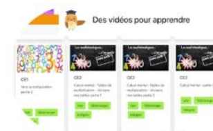
Vidéos pour apprendre