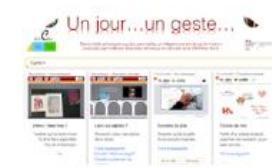
Un jour... un geste...