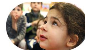
J'enseigne au cycle 1 Eduscol