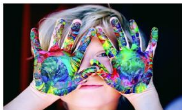
Les activités artistiques