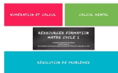
Ressources pour la formation Cycle 2