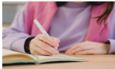
Production d'écrits C2-C3