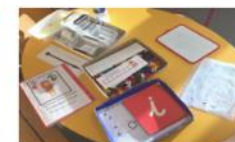
Concevoir les apprentissages (emploi du temps, progression, préparation, ...)