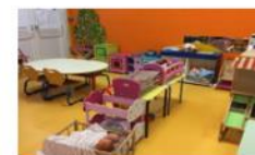
Aménager le temps et les espaces