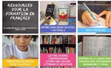
Ressources pour la formation