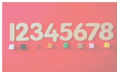
Construction du nombre Numération