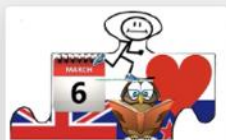
My puzzle picture