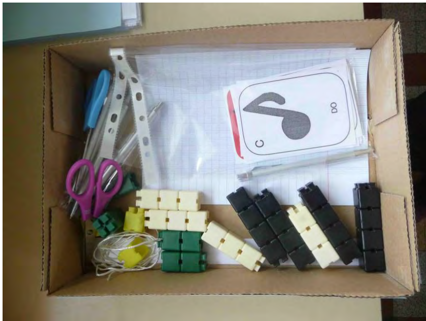
Boîte avec matériel élèves