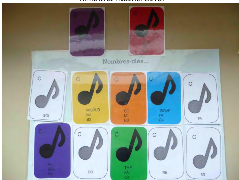
Notes (10 notes parmi lesquelles l'élève doit en choisir 5)