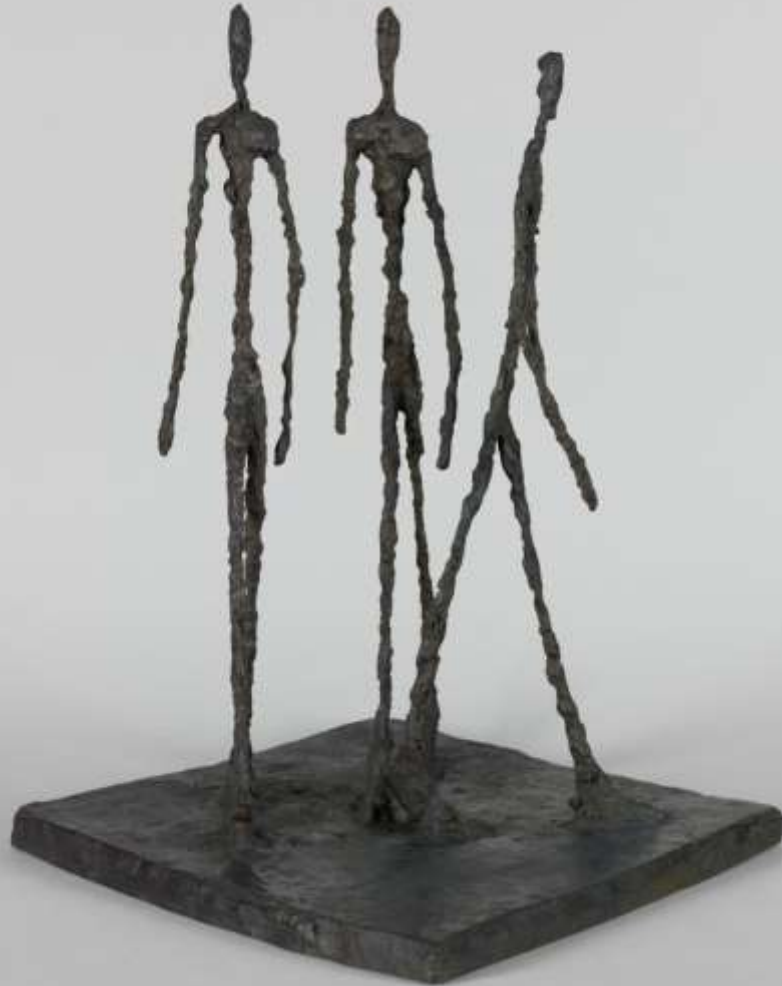
Trois hommes qui marchent