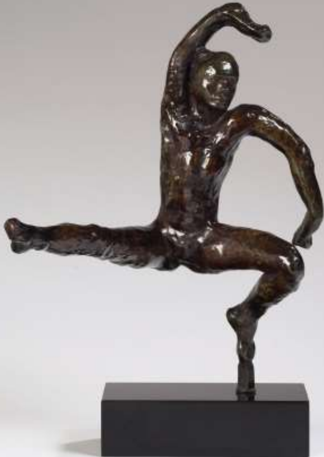
Mouvement de danse F