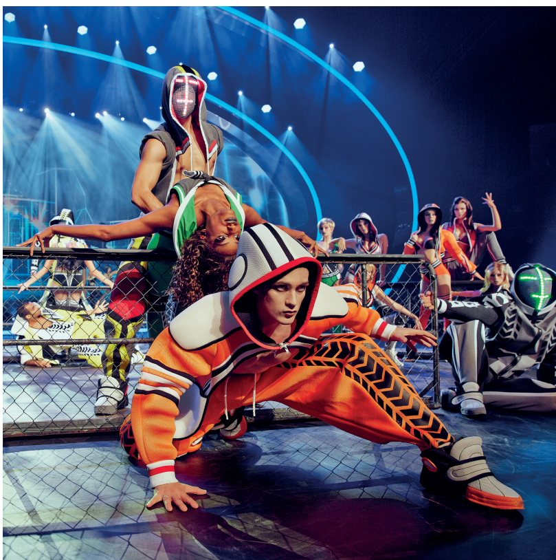
Thierry Mugler , The Wyld, Urban Tribe