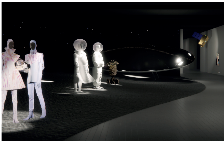
↑↑ Le Tripostal © Nicolas Dhuren ↑ Simulations de l'exposition © Malik Benkahla - collective works