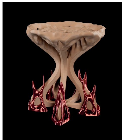
Henri Vanhaerents , Métaphraser la solitude © Henri Vanhaerents

L'ensemble est construit avec plus de vingt pièces imprimées en 3D, utilisant des filaments biosourcés produits à partir de marc de café recyclé et de coquilles d'huîtres, alliant innovation esthétique et conscience environnementale.