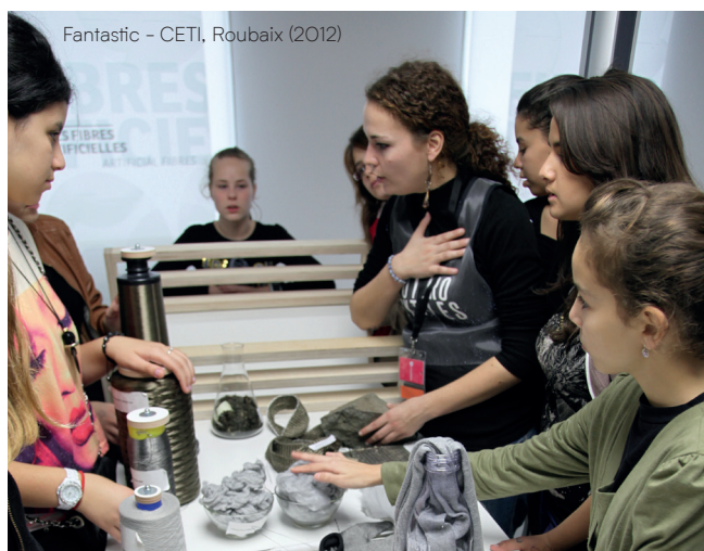
Fantastic – CETI, Roubaix (2012)