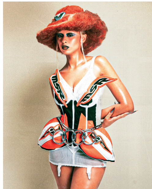
Maison Mourcel , Jade

Les fonctionnalités des vêtements sportifs sont nombreuses. Grâce aux recherches et développement les plus récents, les tissus "nouvelle génération" sont polyvalents : ils régulent la température du corps, voire évacuent la chaleur produite lors de la pratique intensive d'un sport et isolent le sportif contre les températures extérieures extrêmes.