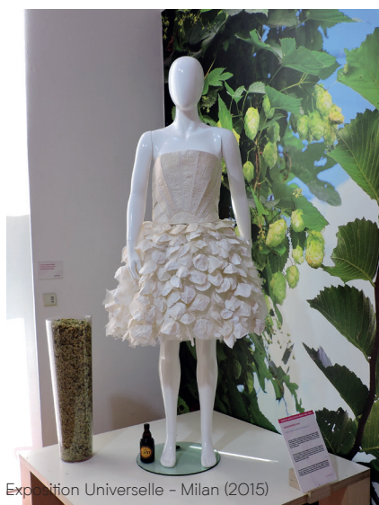
Exposition Universelle – Milan (2015)