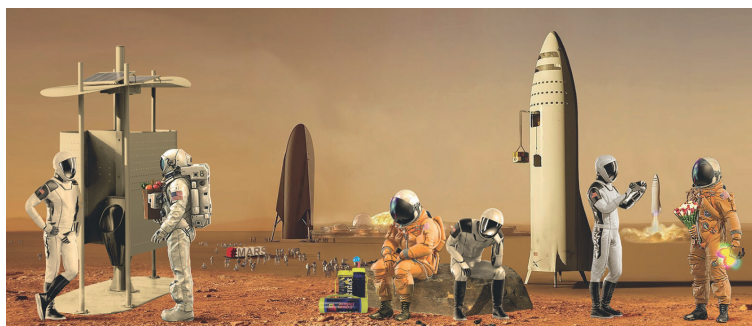
Xavier Duffaut , Panoramars