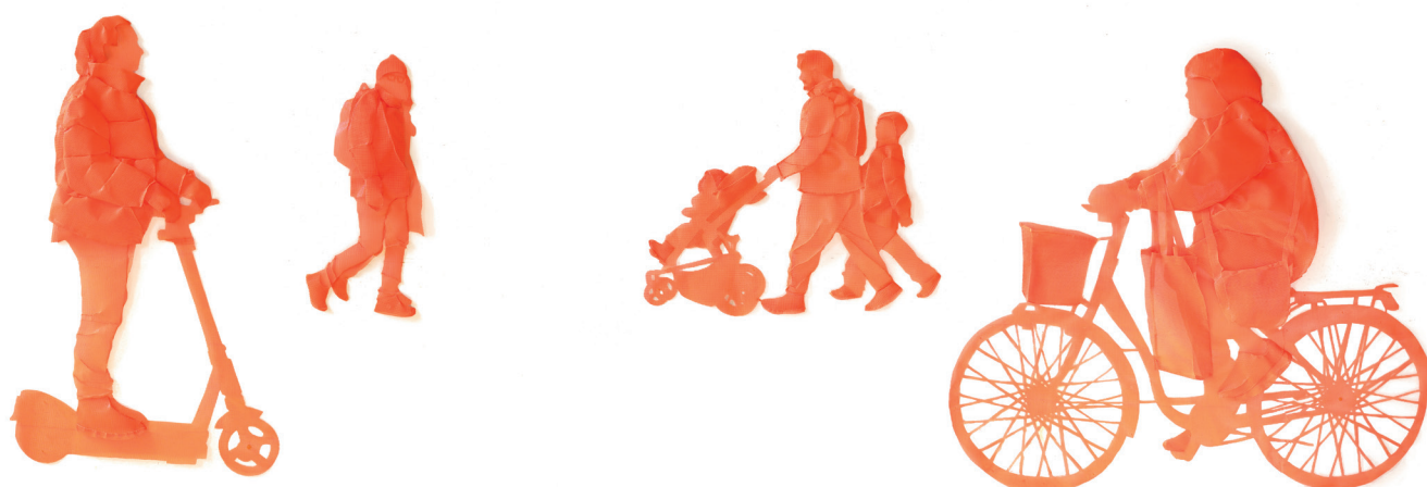
Harumi Ori , Örebro, I am Here