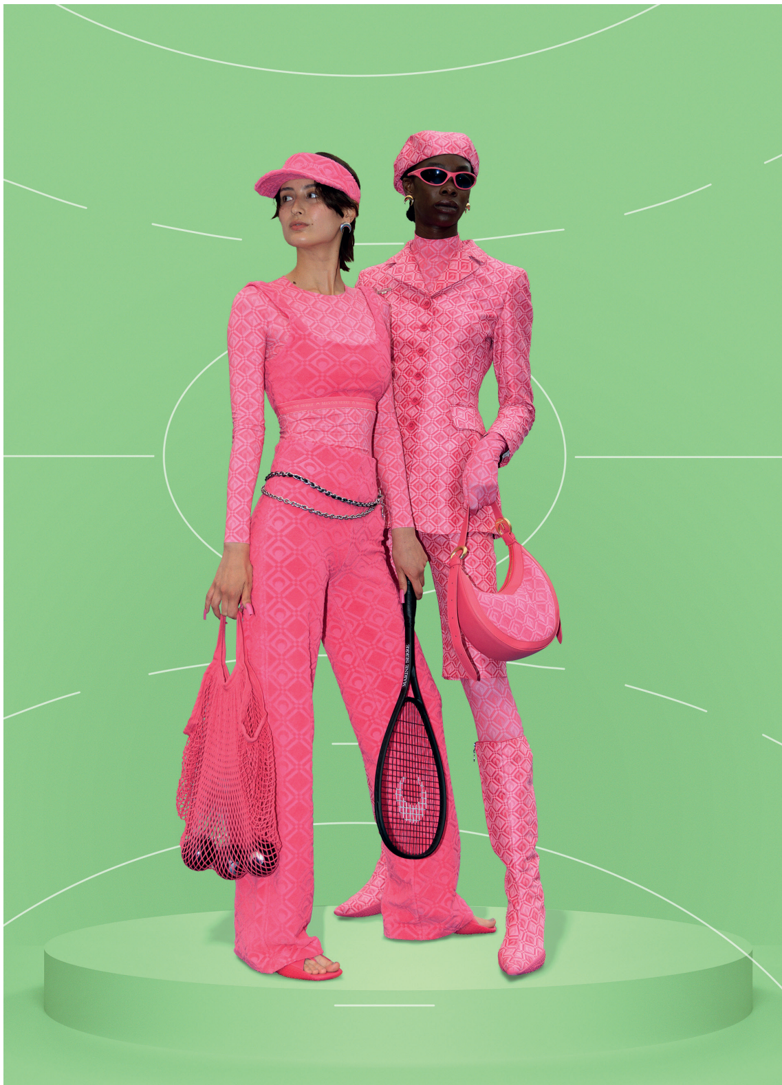
Marine Serre , State of Soul - SS23