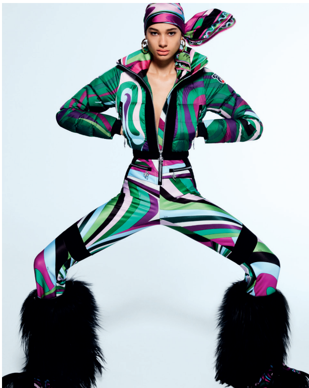
Pucci , Combinaison Clarisse