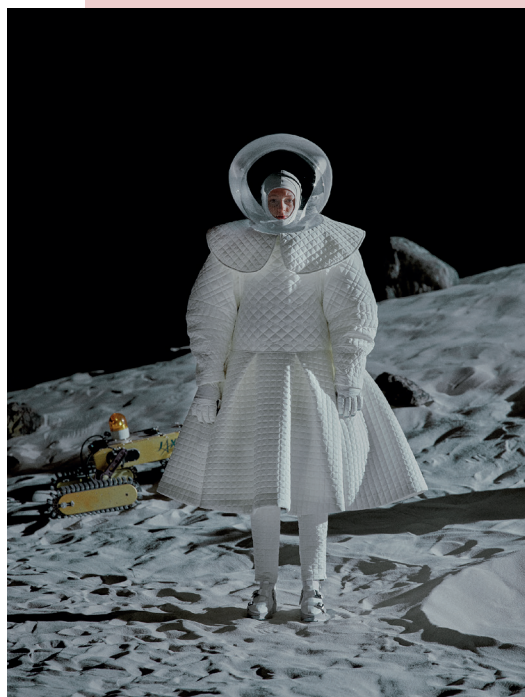
Anrealage , AW2223 © Anrealage

La collection "Planet" automne-hiver 2022-2023 s'inspire des premiers pas de Neil Armstrong sur la Lune, avec des combinaisons spatiales poétiques et surréalistes des astronautes pour les Terriens en quête de paix. La scénographie du Tripostal reproduira une ambiance lunaire.