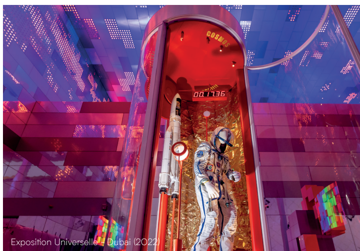
Exposition Universelle – Dubai (2022)