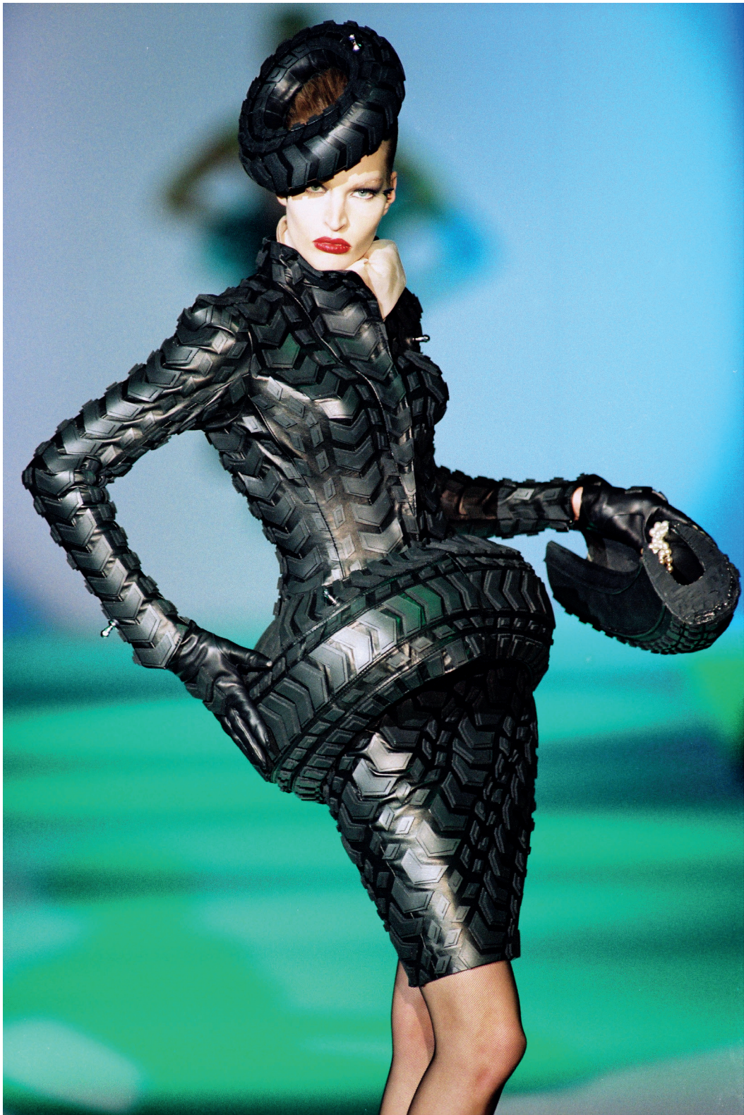
Thierry Mugler , Tailleur Pneu – Collection Insecte – 1997