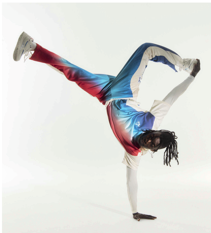
Le Coq Sportif , Stéphane Ashpool pour les Jeux Olympiques 2024