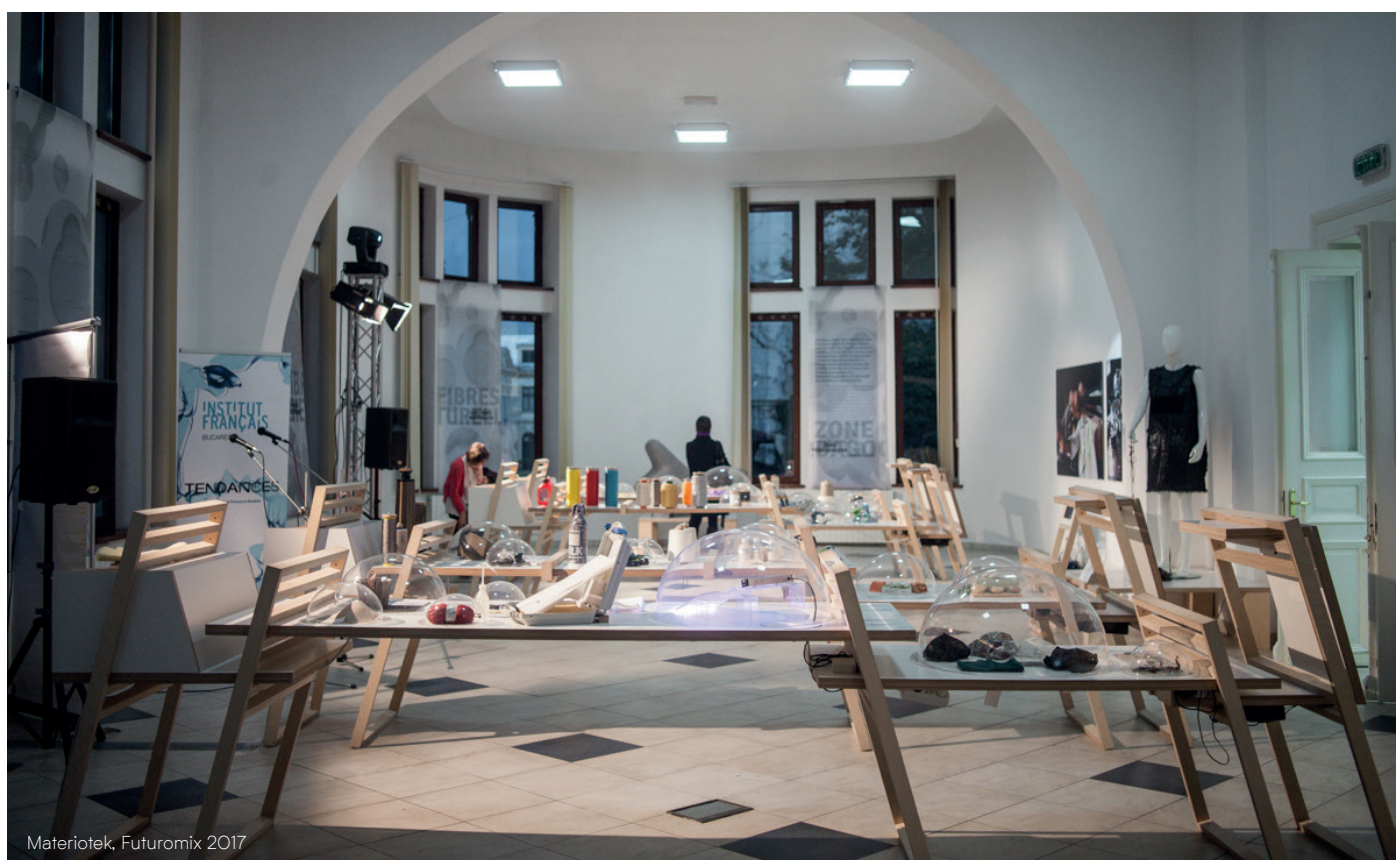
Materiotek, Futuromix 2017