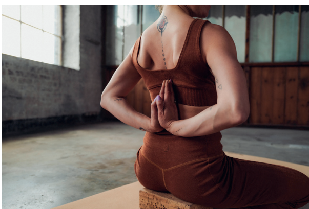
Juin fait le lin , Ensemble Yoga en lin

Le basalte s'utilise principalement dans l'isolation thermique et les éco-constructions. On le retrouve également en tant que matériau composite dans certains équipement sportifs, dans les coques de bateaux et, plus étonnant encore, dans les prothèses et orthèses.