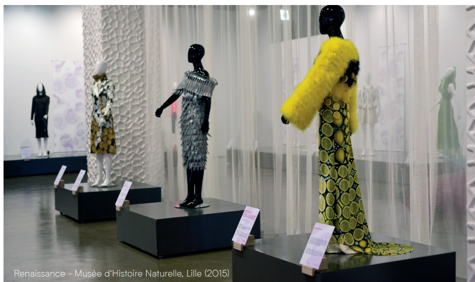
Renaissance – Musée d'Histoire Naturelle, Lille (2015)