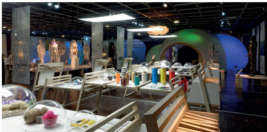
La matériothèque