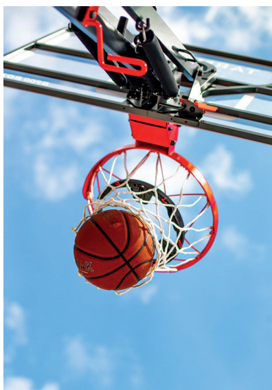
Decathlon , Panier Basketball Play