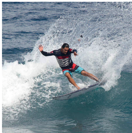
Saint Jacques Wetsuits , Noé