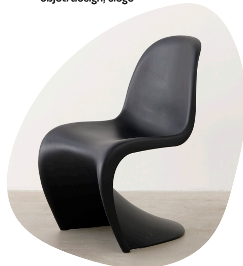
Verner Panton, Chaise Panton , 1959