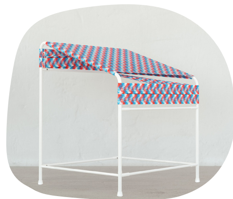
Smarin, (Stéphanie Marin, dite), La sChaise , 2019