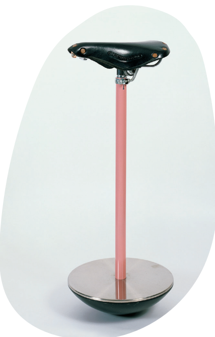
Pier Giacomo Castiglioni, Achille Castiglioni, Sella , 1957