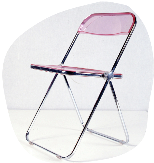
Giancarlo Piretti, Chaise Pli , 1969