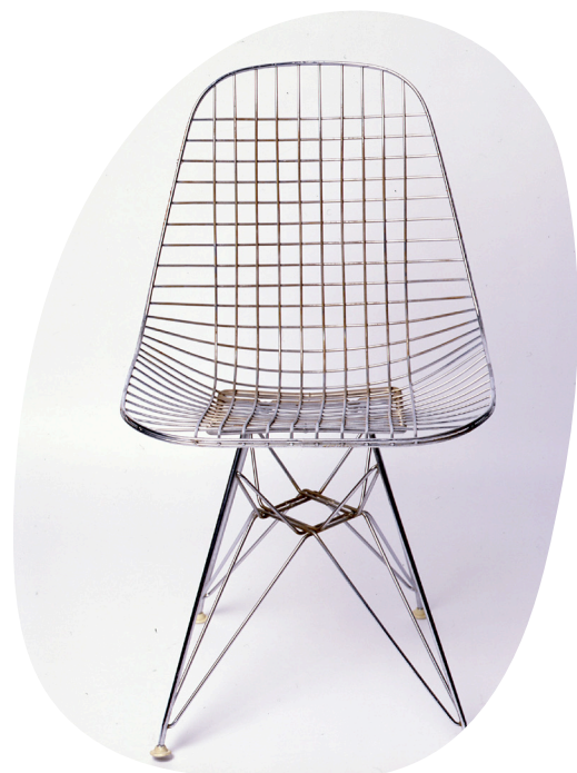
Charles Eames, Tour Eiffel , 1951